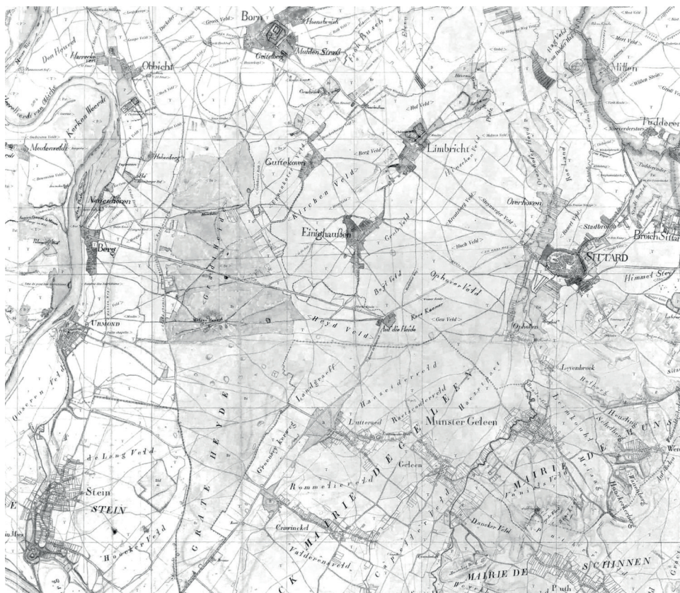
Omgeving Limbricht, Einighausen, Berg en Sittard, rond 1600-1800.