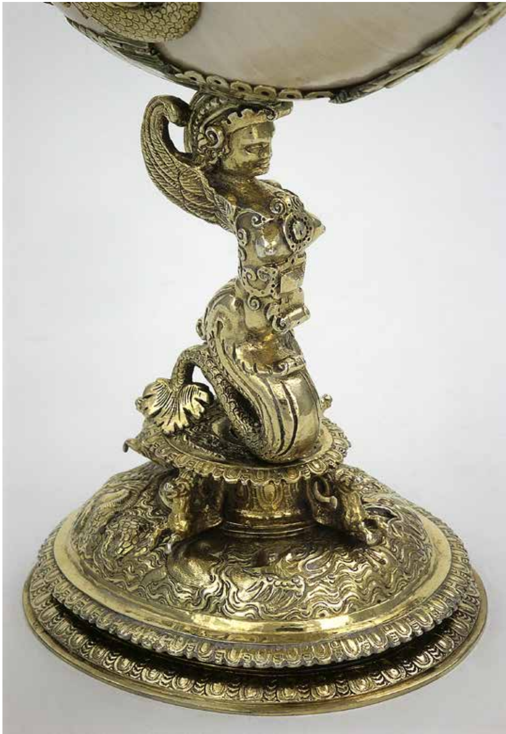
5 details Nautilusbeker