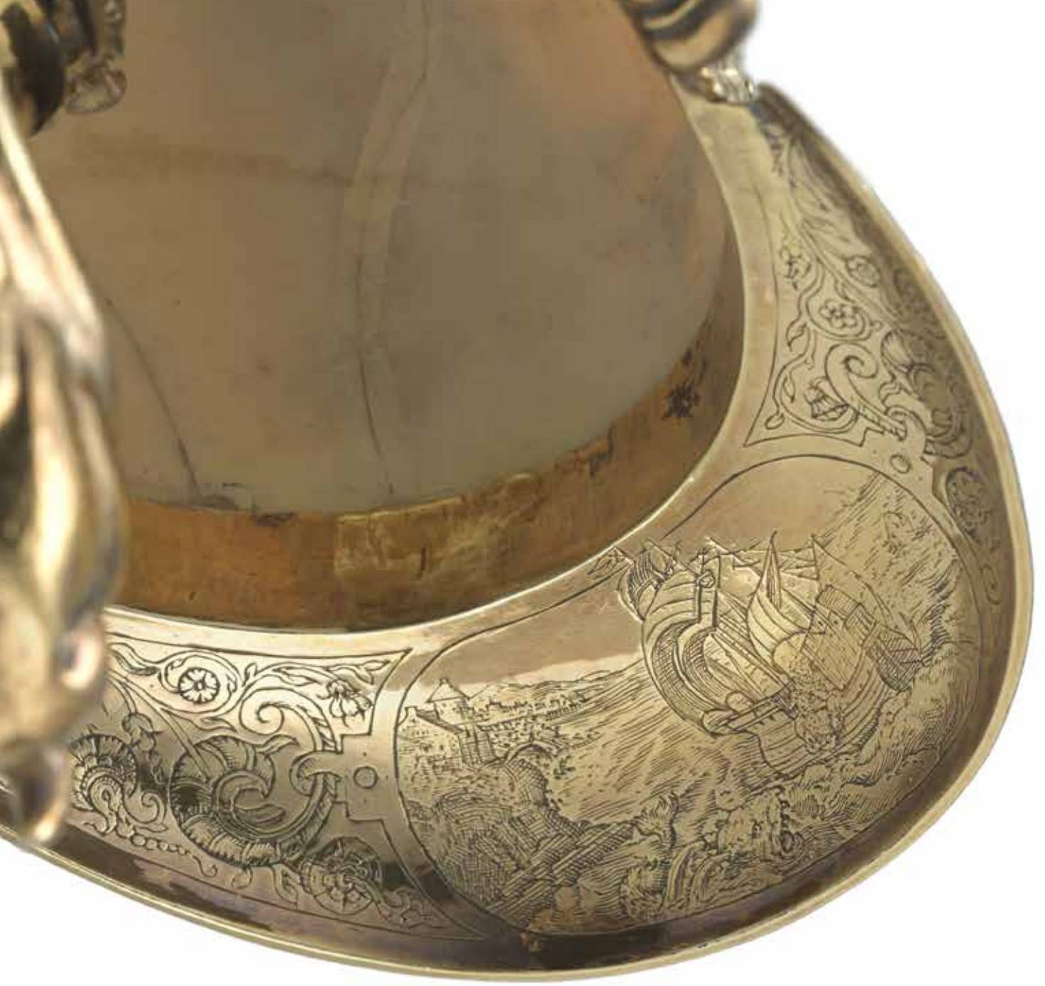
6 details Nautilusbeker