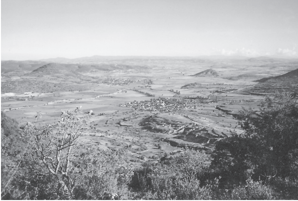
1. Het ruige gebied van de Mixteca Alta, met in de verte de archeologische vindplaats en stad Yucuita. Yucuita is de oudste nederzetting in Noord- en Zuid-Amerika die ononderbroken bewoond is geweest en gaat terug tot 1350 v.Chr.