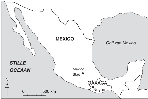
Mexico met de regio Oaxaca.