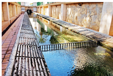
De Font Gran en de wasplaats.

De andere bron, de Font Menor, ligt bij het binnenkomen van het dorp. Vroeger ontstonden twee woonkernen, ieder bij een van de bronnen, maar met de gestadige groei van de bevolking vormen die nu één dorp. Simat heeft natuurlijk ook een kerk, opgedragen aan de aartsengel Michael, in het Spaans San Miguel Arcángel. Het is een gebouw in barok uit de zeventiende eeuw met een eenvoudige gevel. De kerk is alleen open tijdens de misuren, maar biedt geen grote bezienswaardigheden.