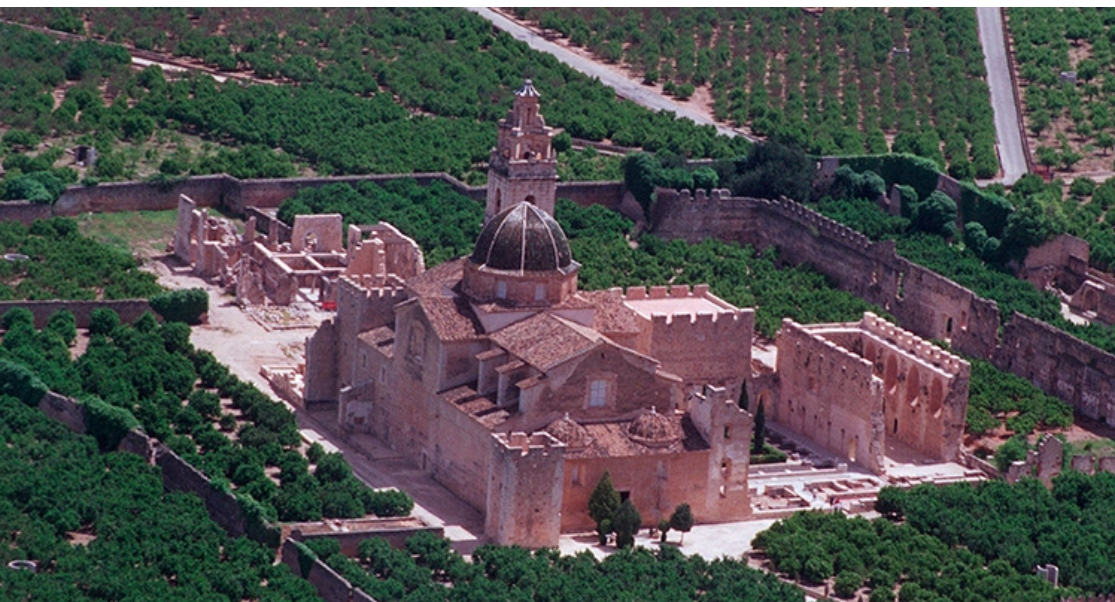
Luchtzicht van de ruïnes van de abdij van Simat de Valldigna