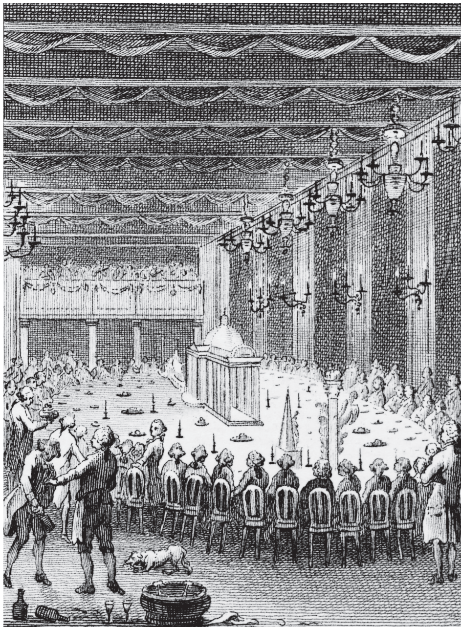
Patriotten met elkaar aan tafel in de Amsterdamse Doelen. Deze maaltijd is van een paar jaar na het maal in 1683, maar de sculpturen van suikerwerk waren hetzelfde.