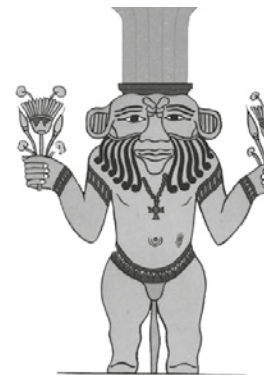
De god Bes, beschermer van het huishouden

De nogal lelijke maar sterke en woeste god Bes was de favoriete beschermer van het Egyptische gezin. Men geloofde dat zijn gedrongen gestalte met een mengeling van menselijke en leeuwachtige trekken, kwade geesten verdreef. In tegenstelling tot veel Egyptische kunst werd hij vaak in een frontale pose voorgesteld, waardoor zijn angstaanjagende trekken goed zichtbaar waren.