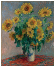
BOEKET VAN ZONNEBLOEMEN 1881