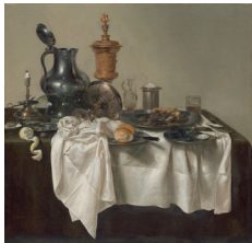
BANKET MET GEHAKTPASTEI 1635