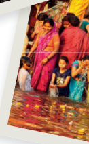
Onder: veel hindoes willen een plekje op de trappen bij de Ganges