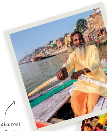
Een sadhu roeit over de Ganges in Varanasi