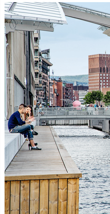
Houten planken, stalen masten – alles zoals in een haven. Staat hier niet ergens het Astrup Fearnley Museum?

'Art made accessible' is de slogan van deze wijk. Kunst moet helpen om bestaande denkpatronen te doorbreken, om ruimte te creëren voor inspiratie. Zelfs op het strand achter het museum, waar kunstwerken (o.a. van Louise Bourgeois, Anish Kapoor en Ellsworth Kelly) in het beeldenpark van Tjuvholmen er haast om vragen te worden beklommen. En dat mag! Uitgeput? Gun jezelf een pauze met een tapashapje of een garnalencocktail of wat de vijftien