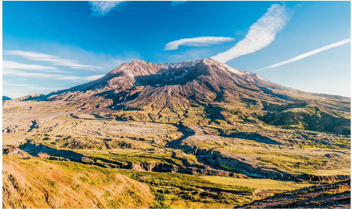
Zelfs ruim 40 jaar na de laatste grote uitbarsting is de natuur rond Mount St. Helens nog lang niet hersteld

Na 123 jaar van inactiviteit ontwaakte Mount St. Helens in maart 1980 uit zijn slaap, wat direct tot veel belangstelling van journalisten en toeristen leidde. Wegen werden afgesloten, bewoners geëvacueerd en wandelen en vissen verboden. In april hield de activiteit aan. De kleine bevingen en stoomeruptions, maar ook het geleidelijke opzwellen van de noordflank waren duidelijke aanwijzingen dat een uitbarsting aanstaande was. Toch zagen velen de ernst van de waarschuwingen niet in. Toen in de vroege ochtend van 18 mei een aardbeving