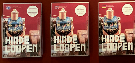
Éric van Hove, motorblok Us Heit , Fries Museum. Foto Gert Wjlage, 2021

Út Marrakesh wei het hy mei ambachtslied mei passy oparbeide oen kómplekse keunstwerken op baesis fan bestaend ridend reau en motorblokken. Mei keunst jêget Van Hove technyse ûntwikkeling en nije wurdearing oen en leet er sên dot ambacht ek yn 'e 21ste iuw tó omstmoaglikheaden het.