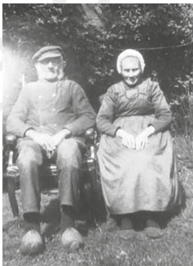
Het huwelijk is een stormachtige zee waarvoor nog geen kompas is uitgevonden (Heinrich Heine).