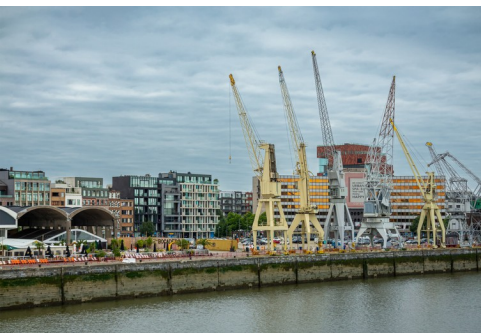
Oude havenkranen langs de oever van de Schelde.

Antwerpen is een moderne havenstad aan de Schelde met zo'n 530.000 inwoners. Ter vergelijking: in Amsterdam wonen ruim 853.000, in Rotterdam ruim 665.500 en in Brussel (stad) 'slechts' 180.000 mensen.