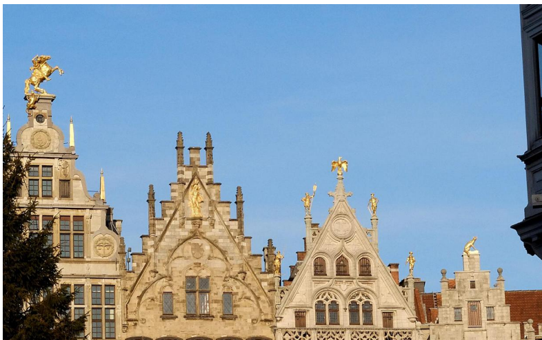
Gevels aan de Grote Markt.

Laat ik dit voorstellen: Antwerpen is geen verlengstuk van Nederland. Je kunt er prima met Nederlands terecht, iedereen verstaat je, maar je bent wel degelijk in een ander land met een andere cultuur. Antwerpenaren zijn, net als Belgen in het algemeen, niet dol op de luid pratende, altijd op geld beknibbelende Nederlanders die overal commentaar op leveren of lachen om wat maar enigszins Belgisch is. Met een beetje beleefdheid en oprechte interesse kom je veel verder en heb je een leuke tijd in Antwerpen.