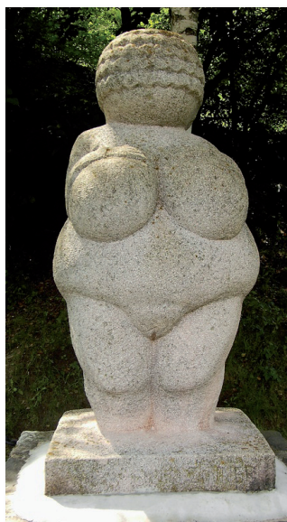
Replica van de Venus van Willendorf, ca. 30.000 jaar oud