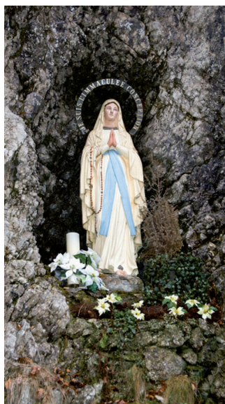
Madonna in de grot, Lourdes, Frankrijk

ren. Uit India en het Verre Oosten komen wierookstokjes, altaren voor de voorouders en goden-cultussen, en uit de inheemse tradities van Amerika, keert de sterke verering van het vrouwelijk-scheppende principe, de 'Pacha Mama' (Bolivia), terug in ons bewustzijn. Met de triomfantelijke opmars van Feng Shui naar het Westen, verspreidt zich de leer van Qi, de alles doordringende levenskracht. Maar de echte bevruchting vindt niet plaats in de ondoordachte overname van andere culturele tradities. De blik op vreemde culturen geeft een impuls. En die leidt naar de herontdekking van onze eigen wortels en de kennis van onze voorouders, de heilige planten, plekken en landschappen. Dit omvat ook de rituele reiniging van het huis, werkruimtes, ruimtes voor bijeenkomsten, en de mens zelf.