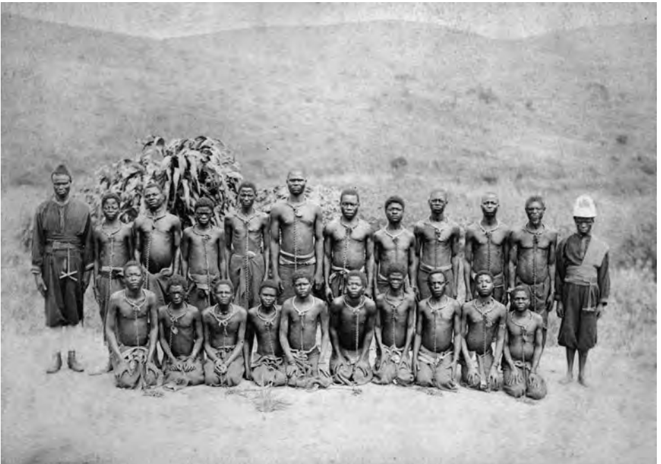
HP 1952.31.9, KMMA collectie Tervuren