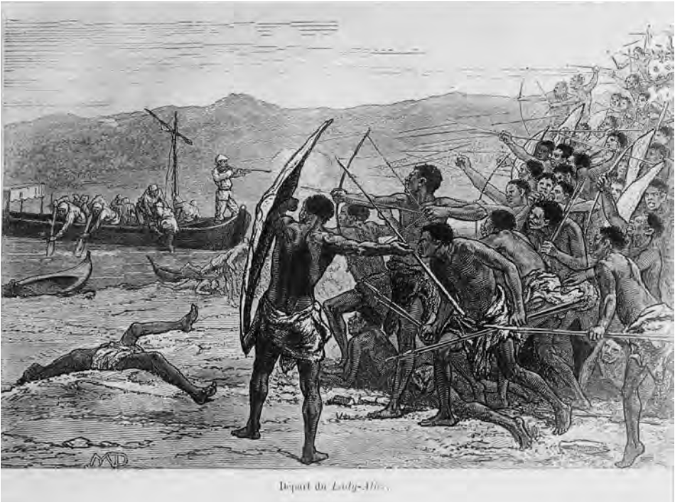
Gevecht tussen inlanders en de expeditie van Stanley op de Lady Alice= Gevecht met inlanders bij vertrek van de expeditie van Stanley op de Lady Alice.

“Inderdaad, doorheen uitgestrekte gebieden zonder landweg, vloeiende de Congostroom waarvan Stanley juist de loop had ontdekt, als een weg die leidde tot het hart van het continent. Vergeleken met de reusachtige Congostroom waren alle andere rivieren die uitmondten in de twee zeekusten van equatoriaal Afrika rivieren zonder belang want zij hadden hun bronnen op luttele afstand van kuststroken en waren met moeite slechts enkele kilometers bevaarbaar met stoomboten. Het is de stamer die het instrument werd van de vreedzame en snelle verovering. Een kleine vloot van steamers die gelanceerd werden op de Congostroom ging meer betekenen in enkele jaren voor Midden-Afrika dan drie eeuwen van moeizame, dure en heroïsche pogingen over land.” ( La conquête du Congo. Histoire de dix ans 1878-1888 , in: Le Mouvement Géographique , Brussel, 9 december 1888).