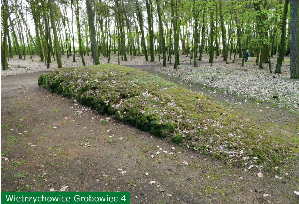
Wietrzychowice Grobowiec 4

Grobowiec 5 is 47 meter lang en 7,5 meter aan de brede zijde. De middensteen ontbreekt. Waarschijnlijk lag hier de ingang naar de houten kamer van 3,75 x 3 meter, die er achter lag. In de kamer lagen de skeletten van twee mannen. De schedel van de jongste (35 jaar) bevatte vier boorgaten die mogelijk waren aangebracht ter genezing van tuberculose. De andere man was 50 jaar en had één gat. Beide mannen hebben de operaties overleefd en zijn gestorven door een natuurlijke oorzaak. Ook hier zijn honderden artefacten in de heuvel gevonden.