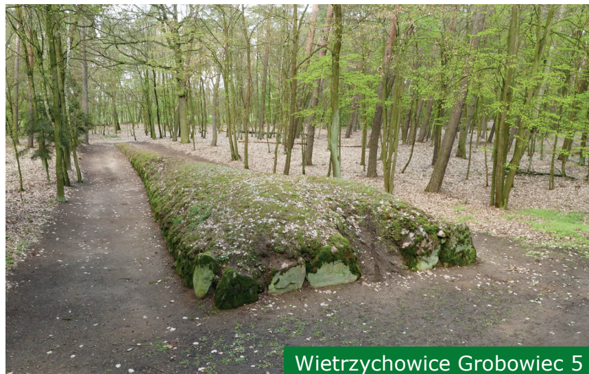
Wietrzychowice Grobowiec 5