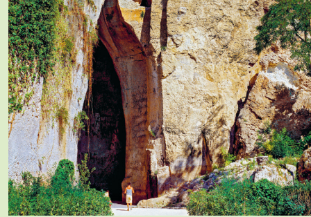
Zelfs de zachtste geluiden worden weerkaatst en bovendien vele malen versterkt door de 23 m hoge wanden van het Orecchio di Dionisio , dat zich over een afstand van 65 m S-vormig in de rotsen uitstrekt

De Ara di Ierone 14 , het altaar van Hieron II, is buitengewoon groot. De lengte bedroeg exact een stadie (een oude lengtemaat die hier 198 m bedroeg), de breedte 22,80 m. Het werd in 466 v.Chr. gebouwd ter herinnering aan de verdrijving van de tiran Thrasybulus en was vermoedelijk gewijd aan Zeus als beschermer van de vrijheid. Elk jaar werden ruim vierhonderd stieren op het altaar geofferd. Ertegenover strekken zich de Latomie del Paradiso 15 uit, overwoekerde steengroeven waar vanaf de 6e eeuw v.Chr. het grijswitte kalksteen voor de gebouwen van de stad werd gedolven. Omdat het beste gesteente zich enkele meters onder de oppervlakte bevond, moesten de arbeiders dikwijls 20 tot 30 m diepe gangen uithakken. Tegenwoordig bieden citroen- en sinaasappelbomen, oleanders en magnolia's hier schaduw en doen daarmee de naam van de locatie eer aan.