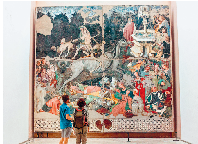
Meedogenloos rijdt de dood over de mensen – te zien in de Galleria Regionale Siciliana

De activisten van Addiopizzo ► blz. 4) bieden excursies in en om Palermo aan. Centraal staan locaties die een relatie hebben met de strijd tegen de maffia, maar er worden ook bedrijven bezichtigd die geen protectiegeld betalen (Addiopizzo Travel, tel. 09 18 61 61 17, addiopizzotravel.it, ma. 17, do. en za. 10 uur vanaf Teatro Massimo, Piazza Verdi, Italiaans/Engels, 3 uur, € 30).